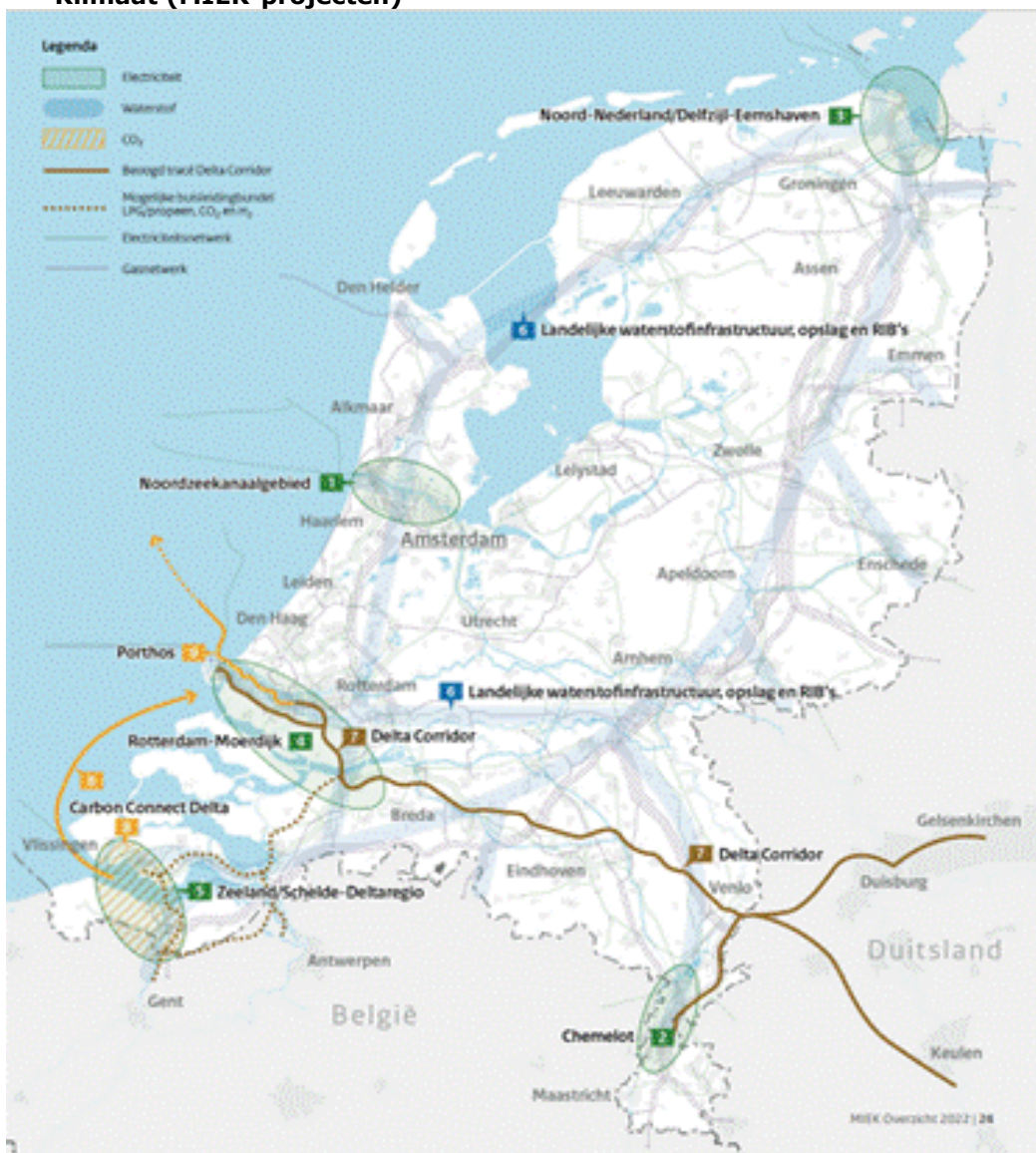
Figuur 2: Totaalkaart Meerjarenprogramma Infrastructuur Energie en Klimaat (MIEK-projecten) 34

In de toekomst zal er naar verwachting ook een andere ruimtevraag ontstaan voor de circulaire industrie om retourstromen duurzaam te kunnen verwerken. Dit vergt bijvoorbeeld meer opslag, omdat minder goederen worden vernietigd of weggegooid. Een ander voorbeeld zijn (binnen)havens op plekken die nu vaak al